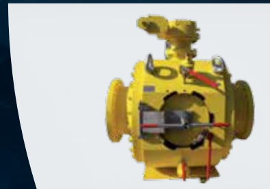
DN 500 PN 50