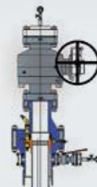
Устьевое оборудование для геотермальных скважин, с рабочим давлением 5000 фунтов/кв. дюйм (350 кг/см 2 )